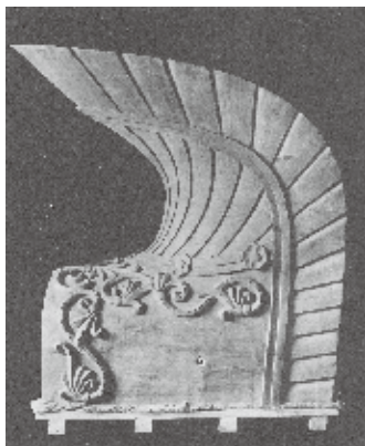
試作復元された法隆寺金堂鷗尾（1954）