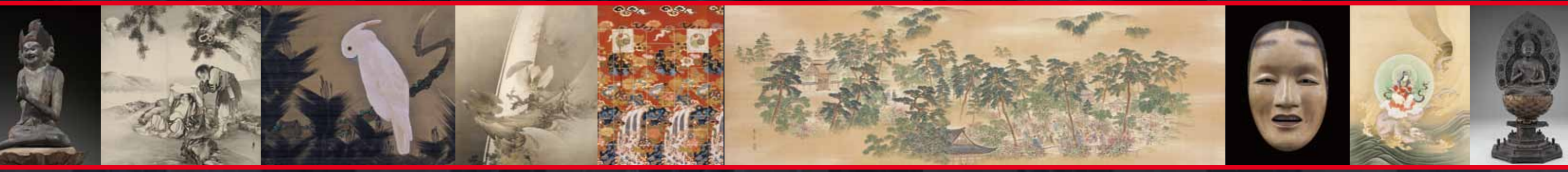
図版篇口絵 (約 40%縮小)